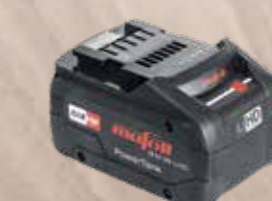
Batteria Accu PowerTank

18 M 72 LiHD Li-Ion, 18 V, 72 Wh Codice art. 094500