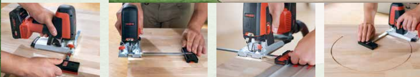
Guida parallela funzioni

Un accessorio, molteplici applicazioni: la guida parallela non solo assicura tagli dritti, ma può anche essere utilizzata per la stabilizzazione su lavori vicino al bordo. Diventa un vero e proprio jolly quando viene usata come adattatore per guide a binario, in combinazione con il sistema di guide a binario F. Attenzione: a seconda che il coperchio rosso sia posizionato in basso o in alto, è possibile lavorare sia sopra che accanto alla guida. Molteplici soluzioni di taglio per rispondere anche alle esigenze di taglio più complesse.