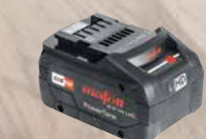
Batteria Accu PowerTank

18 M 99 LiHD Li-Ion, 18 V, 99 Wh Codice art. 094503