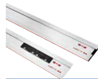
Barra guida F

Ogni progetto ha le sue esigenze specifiche. È essenziale essere ben preparati ad ogni possibile scenario di impegno. Che si tratti di legno, laminato, plastica, metallo, gesso, trespas o eternit: con gli accessori speciali MAFELL per PS 2-18, il risultato finale sarà sempre un taglio perfetto.