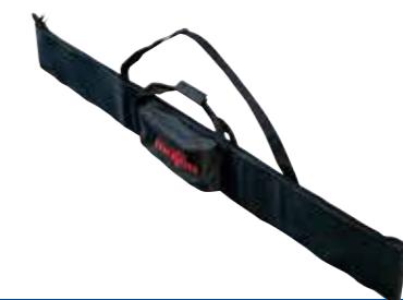
Custodia per guida a binario F

Borsa per barra guida F 160 per guide fino a 1,6 m di lunghezza, Codice articolo 204626. Codice art. 204626