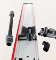
Sistema di Fissaggio e Aspirazione

Set di trasporto per barre guida F 80 + F 160 + F-WA + F-VS + 2 x F-SZ 80MM + Custodia per guida a binario Codice art. 204749