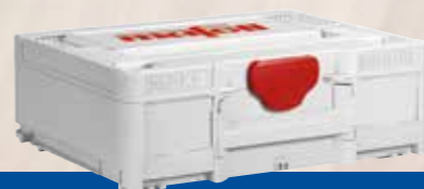
MAFELL MAX 3

Ogni progetto ha le sue esigenze specifiche. È essenziale essere ben preparati ad ogni possibile scenario di impegno. Che si tratti di legno, laminato, plastica, metallo, gesso, trespas o eternit: con gli accessori speciali MAFELL per PS 2-18, il risultato finale sarà sempre un taglio perfetto.