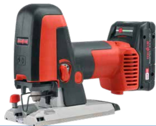
Seghetto alternativo a batteria ad alte prestazioni PS 2-18