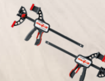
Morsetto F-SZ 180MM

2 pezzi, per il fissaggio della guida al pezzo di lavorazione Codice art. 207770