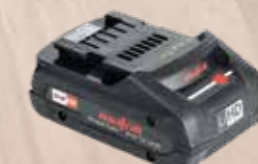
Batteria Accu PowerTank

18 M 72 LiHD Li-Ion, 18 V, 72 Wh Codice art. 094500